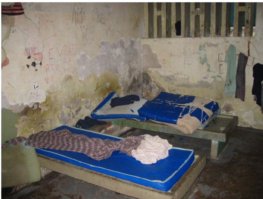
Um dormitório no CAI-Baixada.

A violência contra menores infratores nos internatos do Rio criou um novo fenômeno: em cinco meses, a Defensoria Pública Estadual encontrou 18 adolescentes que preferiam cumprir pena entre adultos, em delegacias ou presídios, a serem submetidos às medidas sócio-educativas em unidades do governo estadual. Ou seja, a cada mês, pelo menos três jovens fingiram ser maiores de idade ao serem presos pela polícia. Descobertos pelos defensores ou por organizações não governamentais, eles dizem que é melhor estar no sistema penitenciário do Estado, envolvido, nas últimas semanas, em denúncias de torturas, morte e corrupção, do que ficar internado nos institutos do Departamento Geral de Ações Sócio-Educativas (Degase). 163