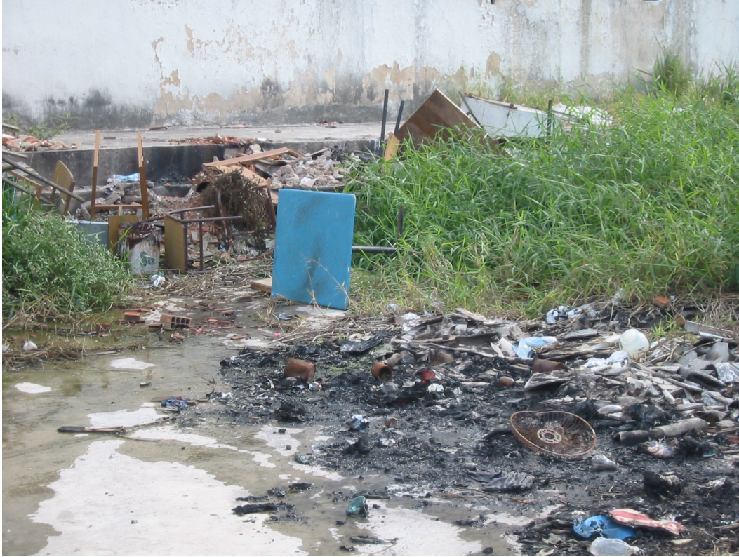
Lixo, água empoçada e mato cobrem uma quadra de basquete no Santo Expedito.