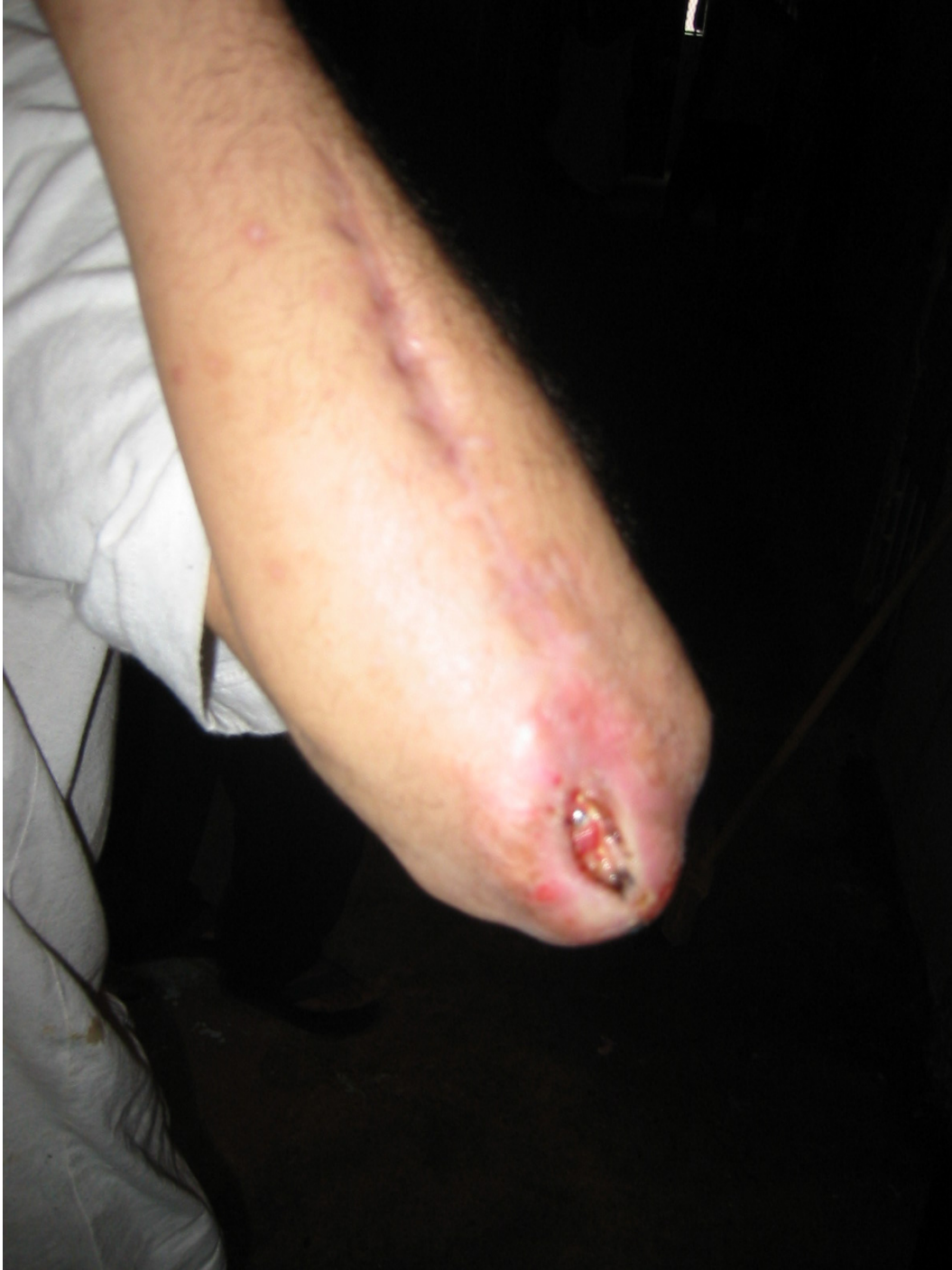
Um jovem do Santo Expedito exhibe uma ferida aberta.